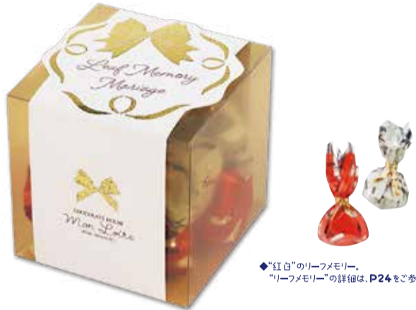
◆“紅白”のリーフメモリー。 “リーフメモリー”の詳細は、P24をご確認ください。

リーフのキューブBOXで、お洒落に可愛く彩りを…。 美味しく可愛く、人気の小さな葉っぱのチョコレート“リーフメモリー”。 “Mariage”に装った、特別なキューブBOXで、記念のお品を、お洒落に可愛く!!