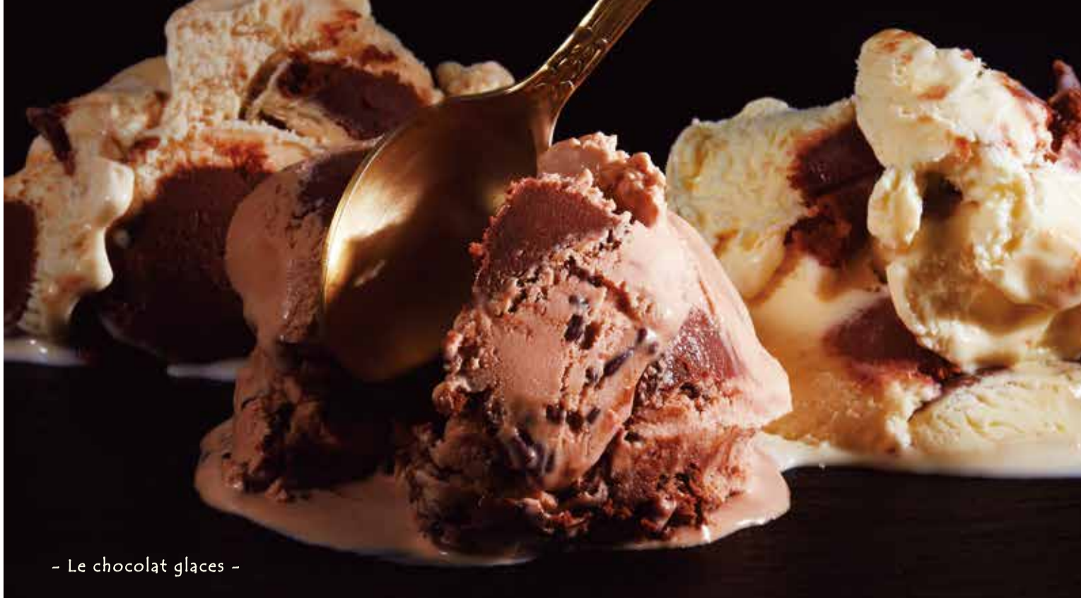
- Le chocolat glaces -