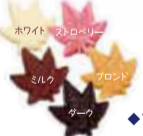
◆“ダーク”は、40枚入りのみとなります。

◆ご了承ください!! 【寿・楓】は、受注生産のため、2週間ほどお時間がかかります。ご注文の際は、ゆとりのあるスケジュールにてお願い致します。