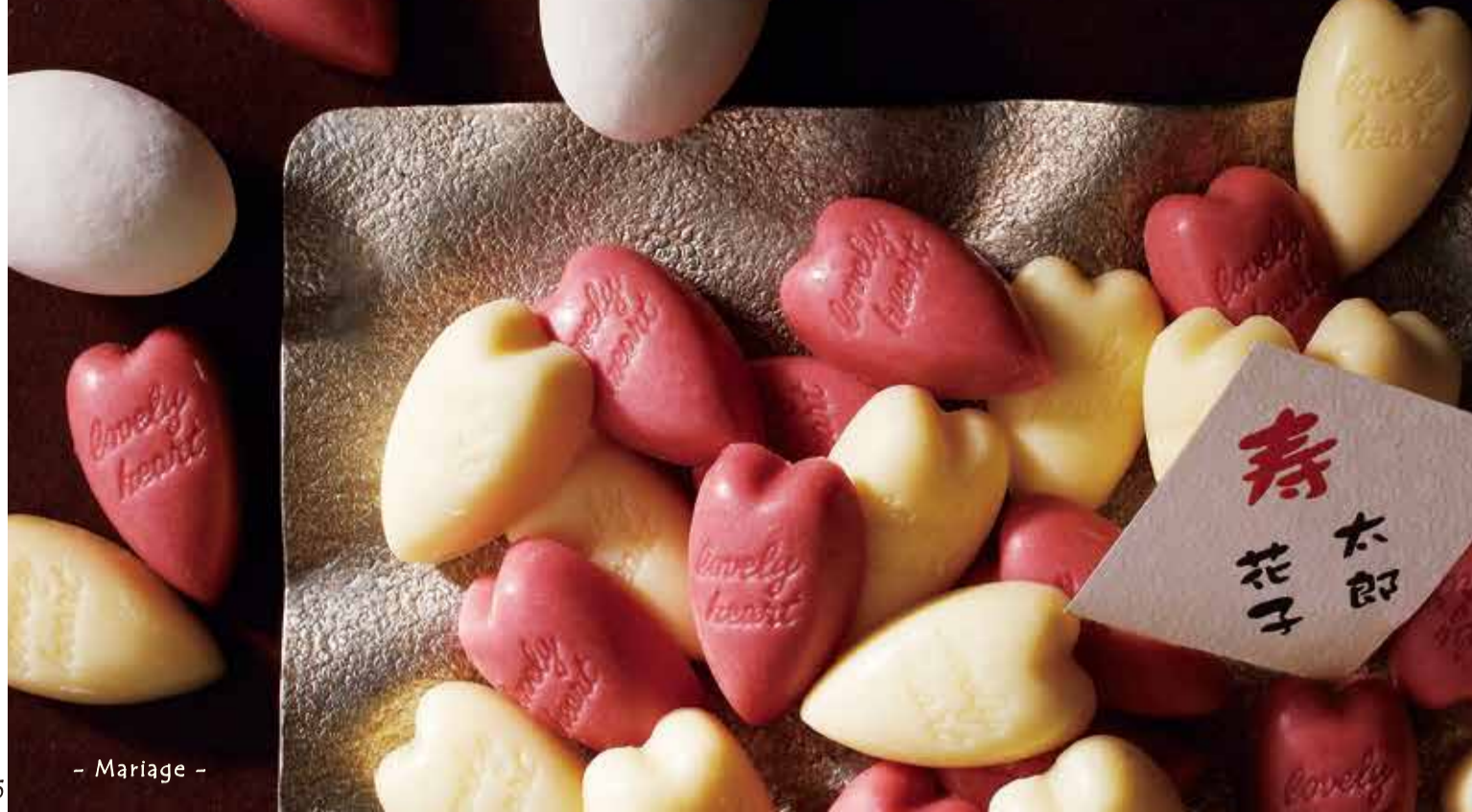
- Mariage -