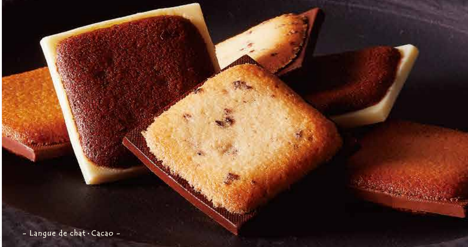
- Langue de chat・Cacao -