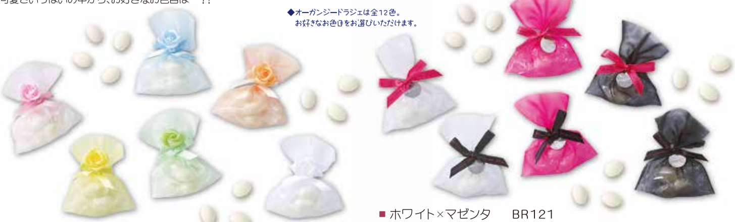
◆オーガンジードラジェは全12色。 好きなお色目をお選びいただけます。

■ピンク BR111 ■ブルー BR112 ■ホワイト BR113 ■イエロー BR114 ■グリーン BR115 ■オレンジ BR116