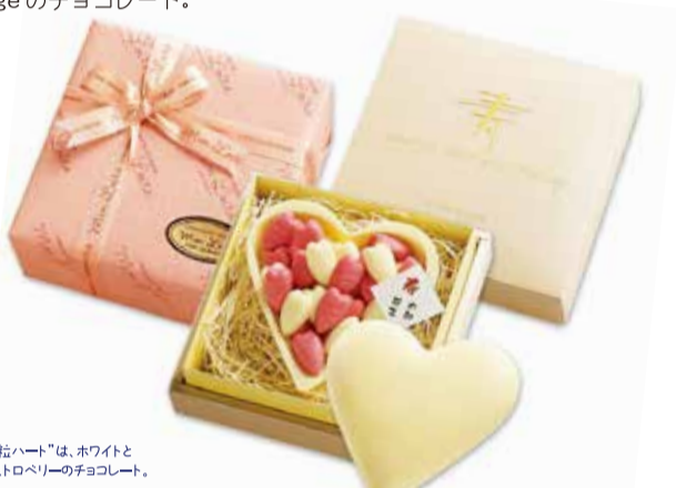
◆“粒ハート”は、ホワイトと ストロベリーのチョコレート。

ホワイトのハートチョコの中に想いを込めて…。 チョコレートでできた白いハートの中から、たくさんの紅白の粒ハートと、 ◇のお二人のお名前が入った寿カード。しあわせを沢山とじこめた、 Mariageのチョコレート。