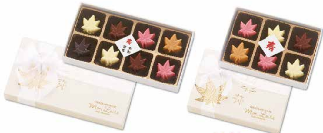
◆“寿・楓”は、1枠に5粒ずつ、 5段重ねに入っています。

紅白の楓の葉は、しあわせのおまじない…。 紅白と、チョコレート色の小さな楓の葉のチョコレート。 ホワイトの楓のモチーフのボックスに、とっても清楚で、キュート。 真ん中の◇の寿カードにお二人のお名前をお入れして、記念の贈り物に。